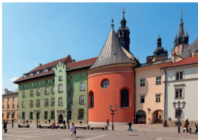
Noblesse oblige.

Zamierzamy ożywić lokal PTT szerszą działalnością organizując w nim prelekcje i wystawy, powrócić do organizacji konferencji z cyklu „Turystyka a Ochrona Przyrody”. Powinno się udać zorganizować kilka wyjazdów górskich. Takie są nasze skromne plany na początek.