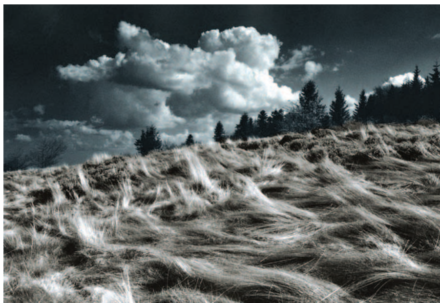
Zdjęcie: Jarek Majcher