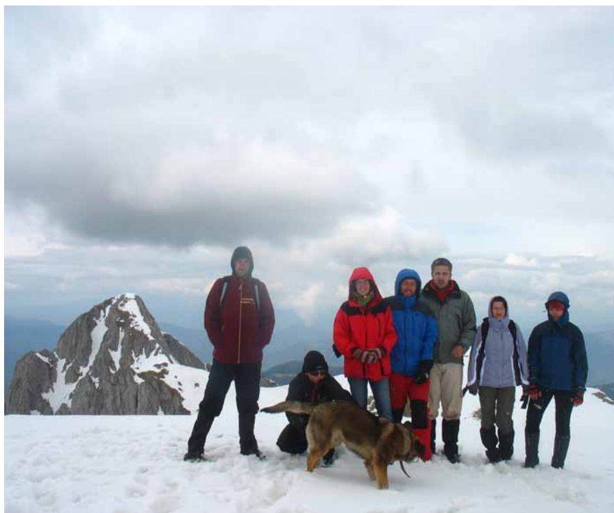
Z tyłu Maglic (2386 m n.p.m.), najwyższy szczyt Bośni i Hercegowiny