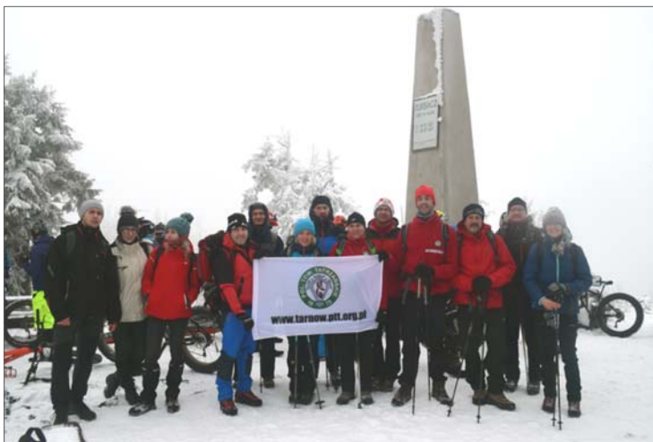
Na szczycie Turbacza

Za Kudłoniem pogoda zaczyna się psuć. Czapa z chmur, która nasunęła się na gorczańskie szczyty schodzi coraz niżej. Na Przełęczy Borek łączymy się z grupą, która wyruszyła niebieskim szlakiem wzdłuż Potoku Kamienickiego. Niestety na podejściu na Czoło Turbacza „łączymy się” także z chmurami i coraz mocniejszym wiatrem. Przyspieszamy kroku. Na szczęście gościnne progi schro-