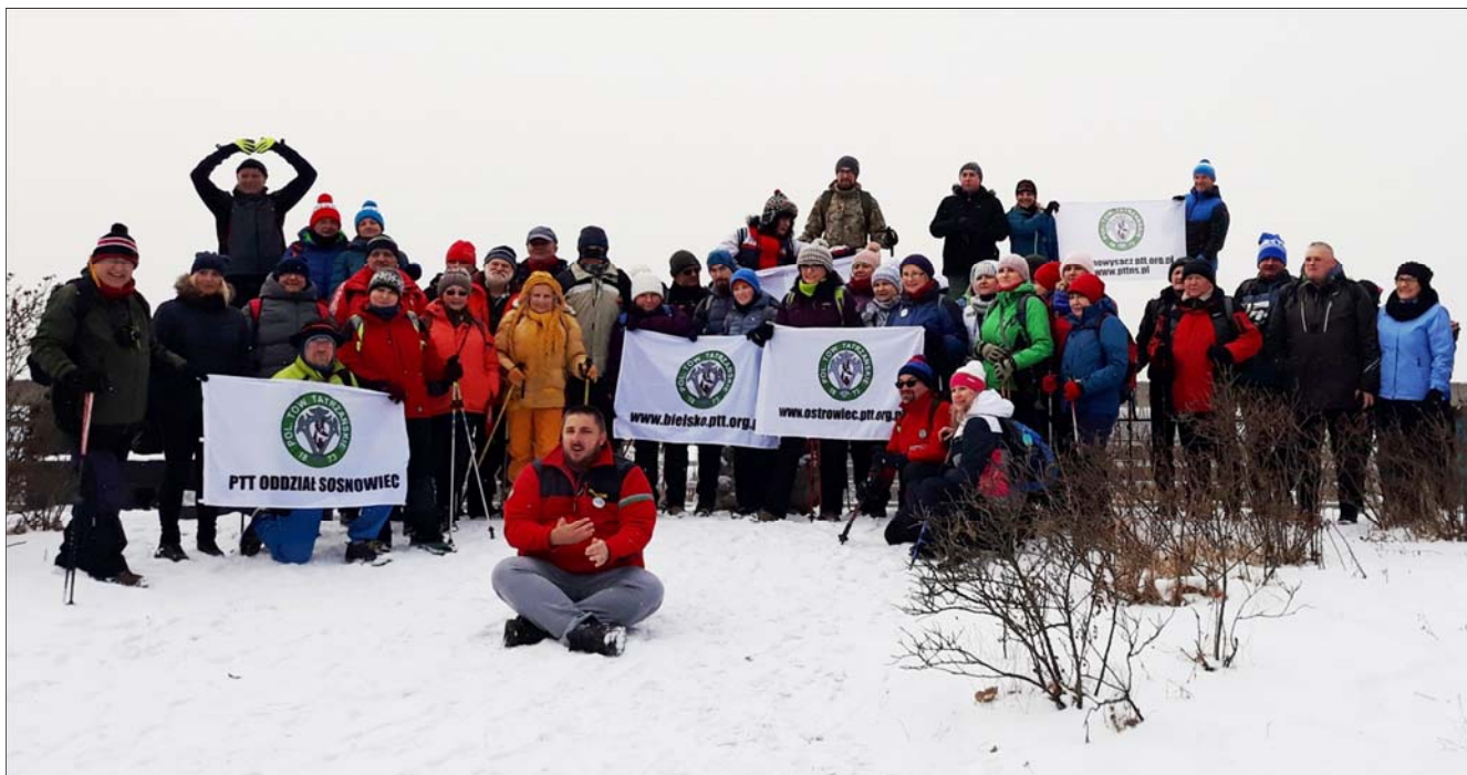
Uczestnicy VI Zimowych Spotkań PTT w Górach Świętokrzyskich w punkcie widokowym na

Dotarcie do celu wyprawy nie było dla zaprawionych w wędrowaniu piechurów, żadnym problemem, choć chwilami