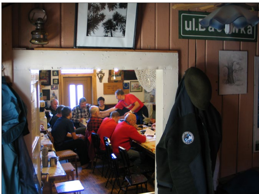
Posiedzenie ZG PTT na Młodej Horze, 2005 r.