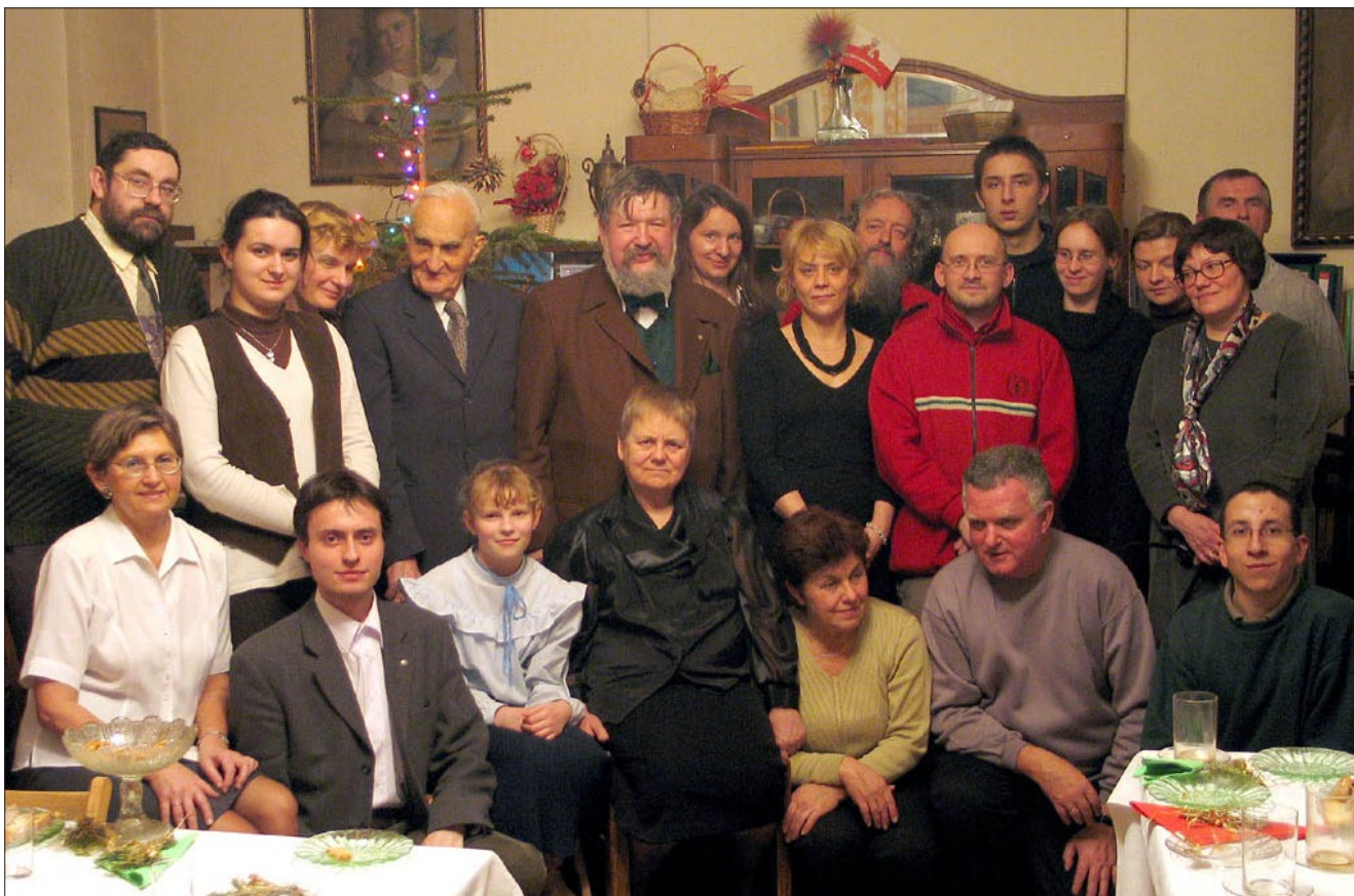
Spotkanie opłatkowe krakowskiego oddziału PTT, styczeń 2005 r.