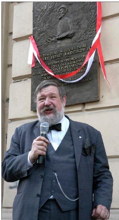
Odstąpienie tablicy pamiątkowej - Rok Walerego Eljasza Radzikowskiego, 2006 r.