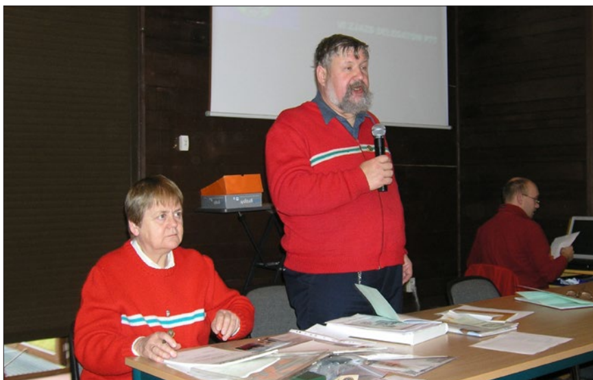
Zjazd Delegatów PTT, 13-14.11.2004 r.