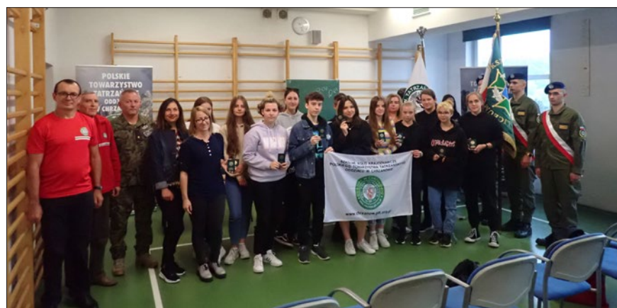
Uczestnicy zebrania założycielskiego w Libiążu