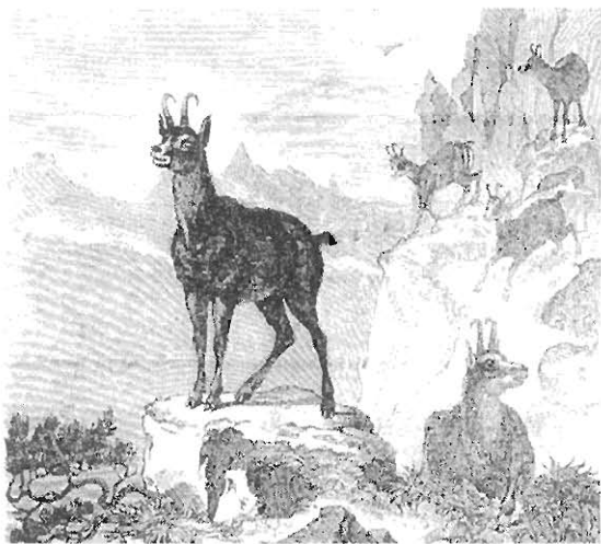
Kozica ( Antilopa rupicapra , die Gemse). Widok przedstawia góry tatrzańskie. Kozica na lewo stoi na strazy stadka.