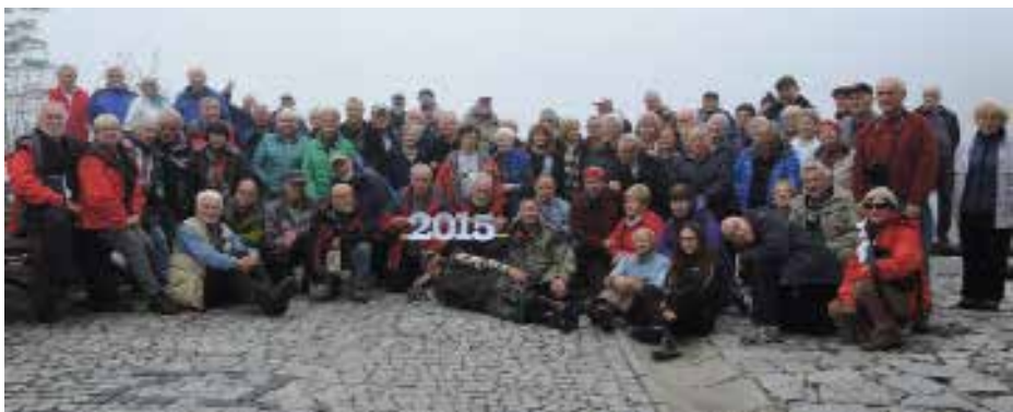
Taternicy-seniorzy przed schroniskiem nad Morskim Okiem