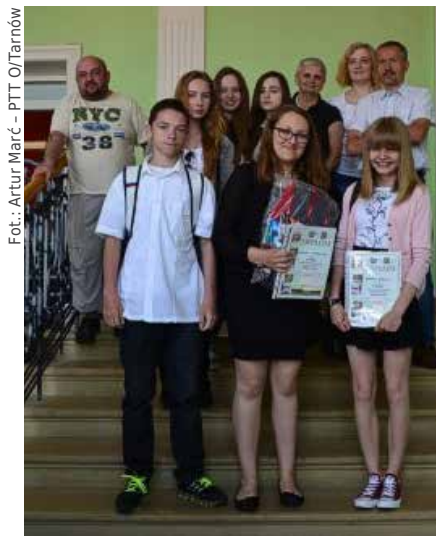
Pamiątkowe zdjęcie laureatów i jury konkursu

W czasie sześćdziesięciu minut uczestnicy musieli wykazać się wiedzą dotyczącą topografii, hydrologii, etnografii i historii Podhala i Spisza. W teście nie zabrakło również pytań związanych z ochroną przyrody i bezpieczeństwem w górach. Zużyte podczas pracy umysłowej kalorie tradycyjnie można było uzupełnić posilając się wafelkami i sokiem owocowym. Po upływie regulaminowego czasu zawodnicy opuścili salę, a do pracy przystąpiło jury. Po sprawdzeniu wszystkich prac okazało się, że w kategorii indywidualnej