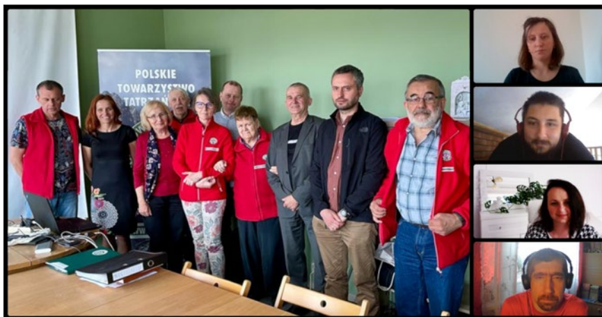
Uczestnicy hybrydowego posiedzenia ZG PTT

Kolejnym ważnym tematem było zatwierdzenie wzoru odznaki organizacyjnej, która będzie dla nas wykonywana z historycznej matrycy, którą ZG zakupił od spadkobierców właściciela. Wiązało się to ze zmianą podjętą w 2019 roku uchwały dotyczącej znaków PTT.