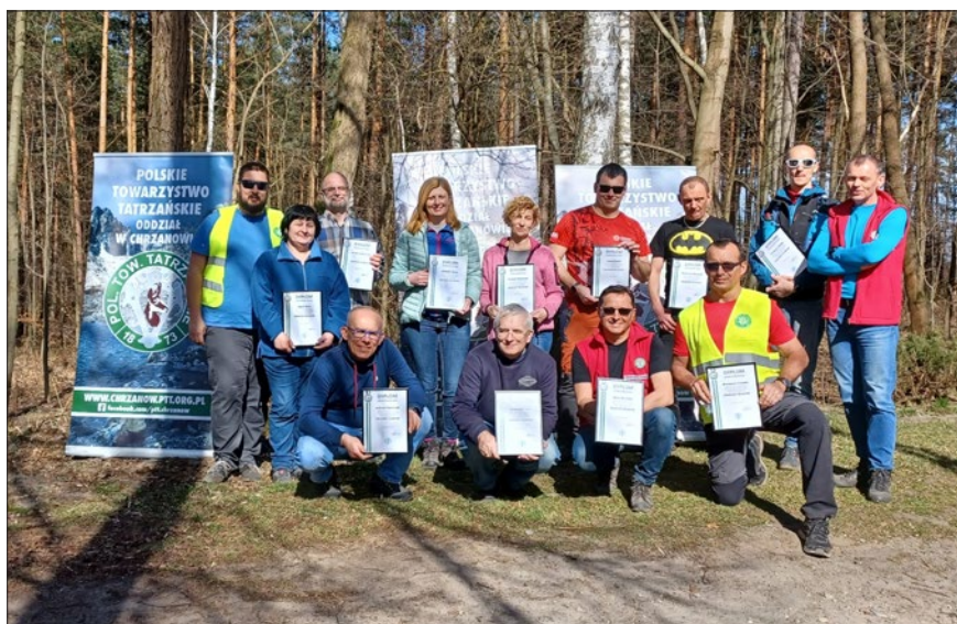
Pamiątkowe zdjęcia na zakończenie szkolenia znakarskiego

Uczestnicy kursu wykazali się zaangażowaniem i chęcią nauki. Wszystkim gratulujemy ukończenia kursu oraz pomyślnie zdanego egzaminu. ■