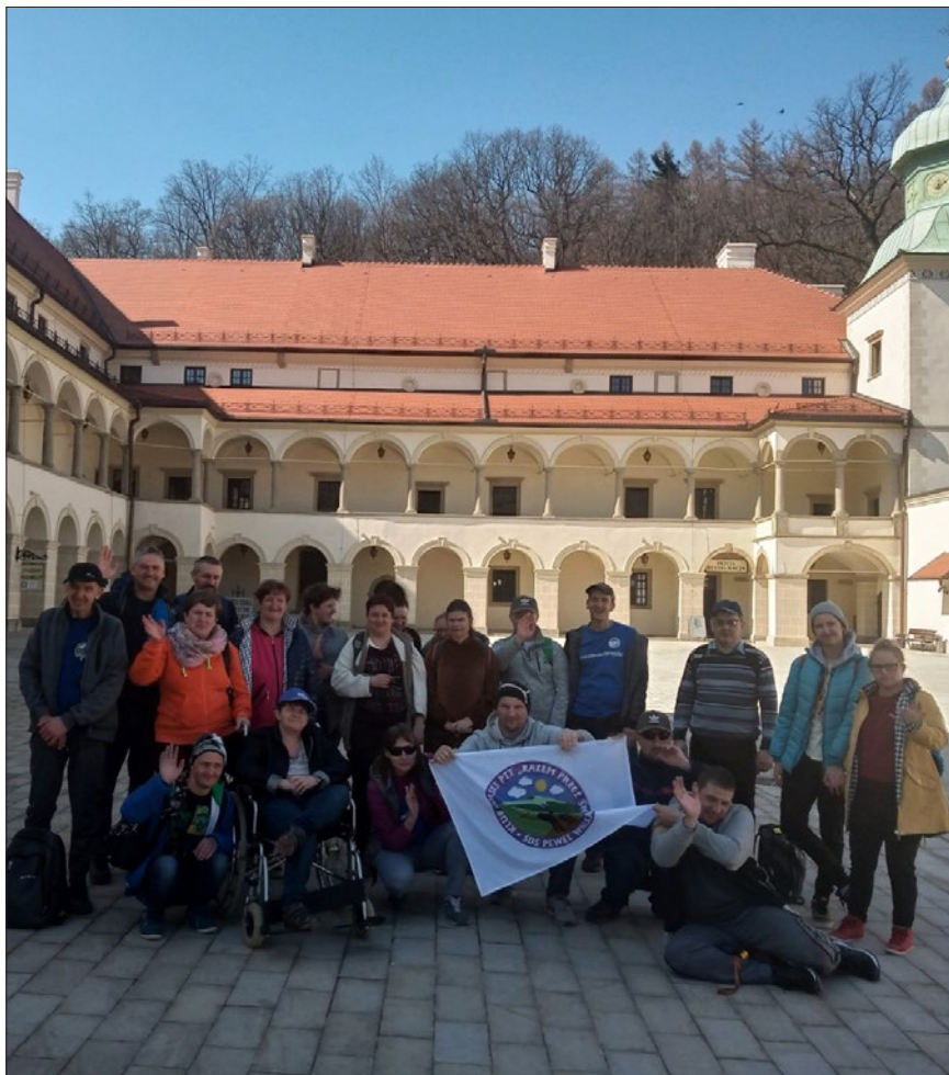
Pamiątkowe zdjęcie całej grupy na dziedzińcu Zamku w Suchej Beskidzkiej

Na kolejną wycieczkę wybraliśmy się znowu w bliski nam Beskid Żywiecki, a tym razem wędrowaliśmy z Korbiewa na górę Furmaniec. Z parkingu w Górnym Korbie-