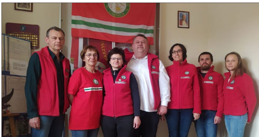
Nowo wybrany zarząd Oddziału PTT „MKG Carpatia” w Mielcu