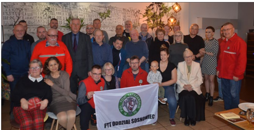
Uczestnicy Walnego Zgromadzenia Członków Oddziału PTT w Sosnowcu